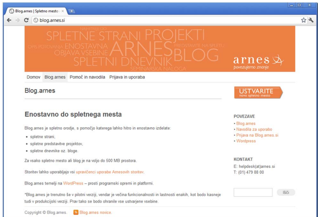
SLIKA 7: BLOG.ARNES.SI

Blog.arnes je na voljo vsem uporabnikom Arnesovih storitev in omogoča prijavo z uporabniškim računom guest.arnes.si ali ArnesAAI . S klikom na gumb "Ustvarite novo spletno mesto" se sproži postopek registracije novega spletnega mesta oz. bloga. Uporabnik po prijavi s svojim uporabniškim imenom in geslom vpiše le še poddomeno spletnega mesta, njegovo ime in klikne na gumb za potrditev. Spletno mesto je takoj pripravljeno za uporabo.