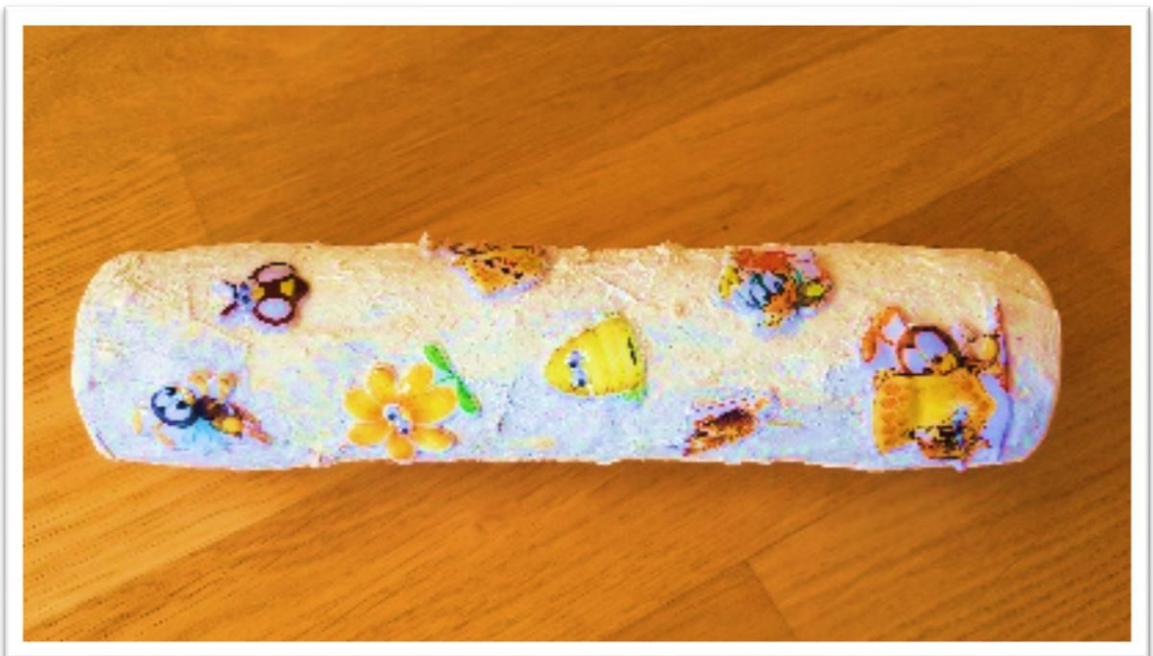
Preprosta dežna palica