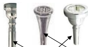
USTNIKI (KOTLASTI IN LIJASTI)