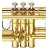
VENTILI IN TIPKE VENTILOV