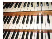
MANUALI ali KLAVIJATURE