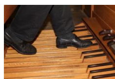
PEDALI ZA IGRO Z NOGAMI