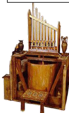
HIDRAVLIS ali VODNE ORGLE