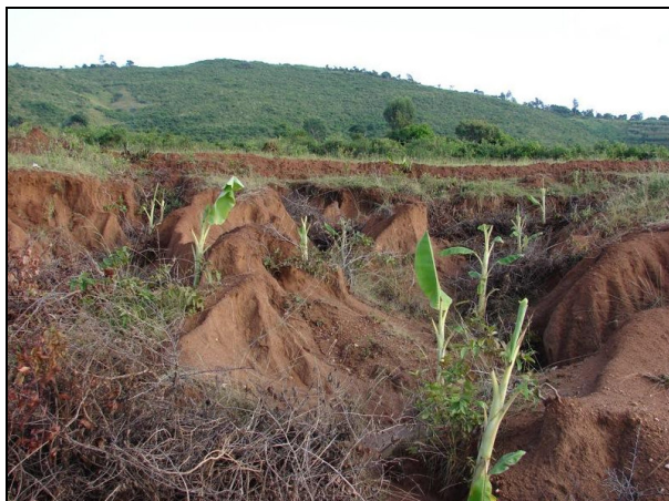
Slika: Sanacija degradirane površine z raznim gradivom in sajenjem bananovcev.

Vir: Africa Soil Information Service. Medmrežje: http://www.africasoils.net/gallery/gallery1 (5. 2. 2010).