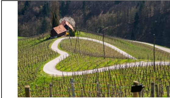
Cesta med vinogradi v obliki srca

Gotovo poznaš cesto v Sloveniji v obliki srca, ki se nahaja v znanem vinorodnem območju?