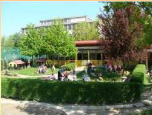
Vrtec na Karunovi