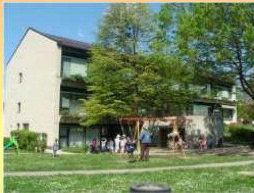
Vrtec na Kolezijski