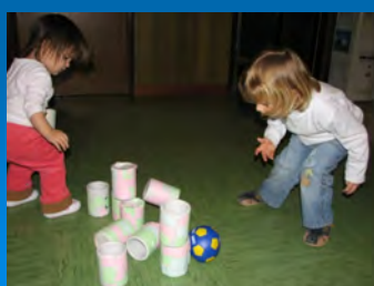
Igra s kegli iz odpadnega materiala