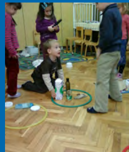
Otroci razvrščajo odpadke v obročje ustreznih barv