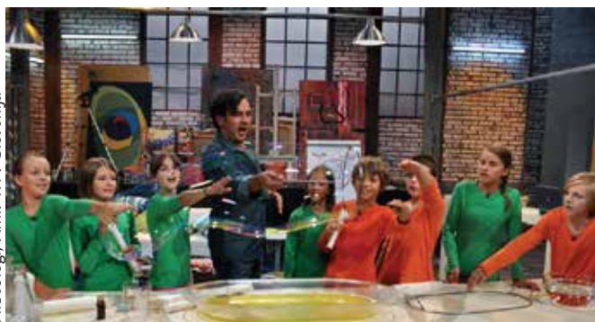
Fircologi, Arhiv RTV Slovenija

Starejši šolarji so trši oreh, ko razmišljamo o tem, kako jih učinkovito nagovarjati s pomočjo televizijske oddaje. Oddaja, v kateri nastopajo njihovi vrstniki, je zagotovo ena izmed možnosti. Mladi gledalci budno spremljajo in komentirajo vse: vedenje mladih voditeljev, njihov govor, čustva, odnose, duhovite prebliske, oblačila, pričeske. V pogovoru z njimi se nam razkrije njihov pogled na svet in življenje. In prav to vam bomo predstavili z ogledom oddaje s šolarji in vodenim pogovorom, ki mu bo sledil.