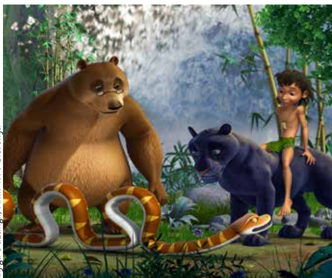
Knjiga o džungli

Medijsko opismenjevanje otrok se začne že v zgodnjem otroštvu in žanr, ki je otrokom najbližji, so zagotovo risanke. Toda – ali so res vse risanke primerne za otroke? Na kaj moramo biti še posebej pozorni, ko se odločamo, katere risanke otroku ponuditi v njegovih prvih srečanjih z mediji? In kakšen pomen ima za otrokov razvoj kakovostna sinhronizacija v slovenski jezik? Na predavanju boste dobili odgovore na ta in še veliko drugih pomembnih vprašanj, povezanih z risankami za otroke.