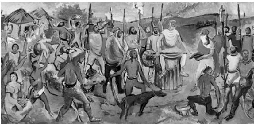
Marij Pregelj, Ustoličenje prvega karantanskega kneza, tempera, 1939