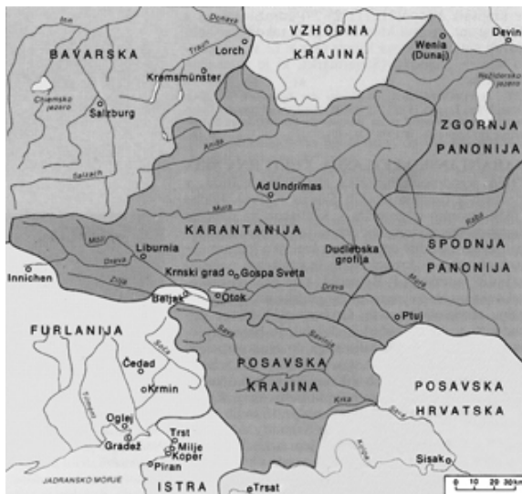
Zemljevid Karantanije (658–743)