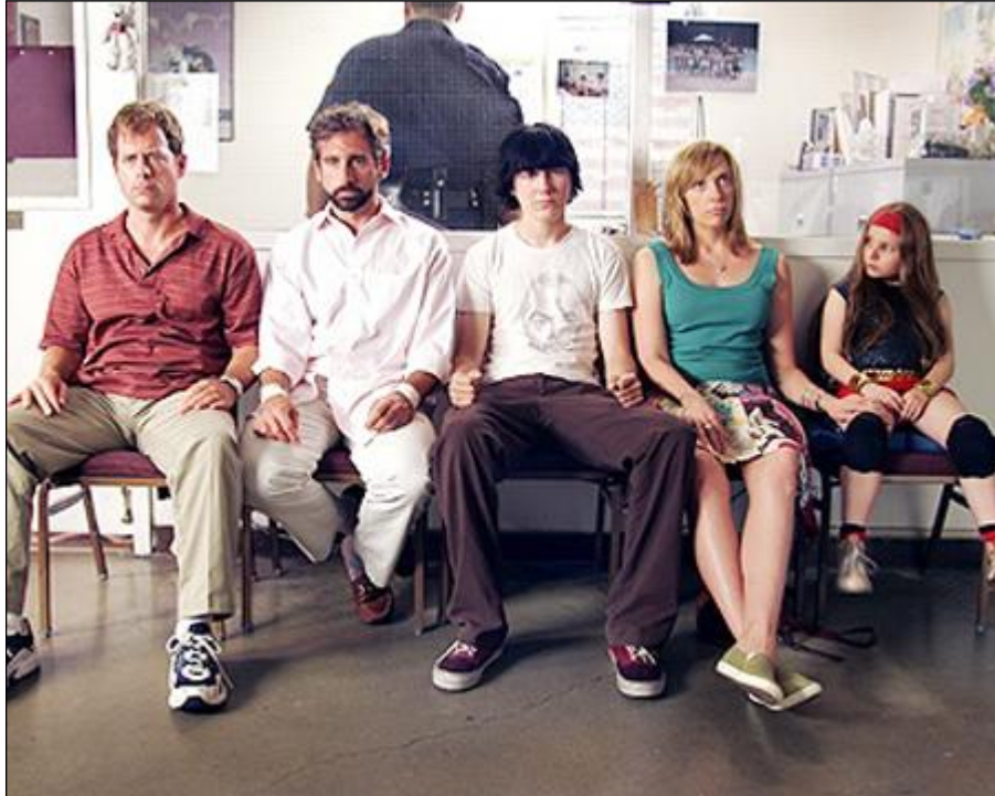
Little Miss Sunshine

»Prava zguba ni tisti, ki ne zmaga. Prava zguba je tisti, ki se tako boji, da ne bo zmagal, da nikoli niti ne poskusi.«