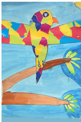
Poslikava ozadja v manj pestrih barvah