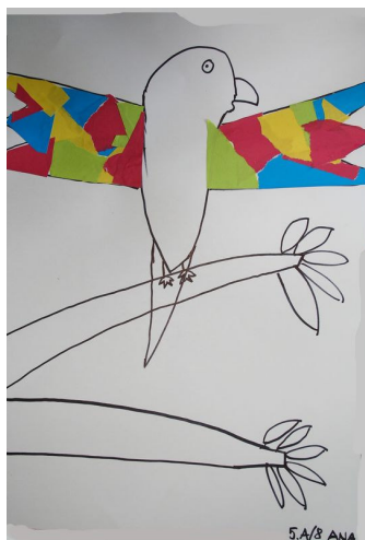
Lepljenje barvnih papirjev v pestrih barvah